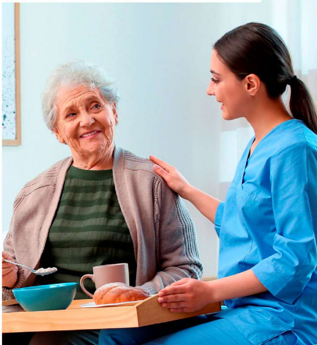
Tabla de beneficios